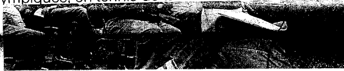
Près de deux cents personnes ont suivi les débats de la fête annuelle de Lutte ouvrière.

Pratique. Rennes-Jar- din, tél. 02 99 51 38 23 ou 02 99 50 61 33.